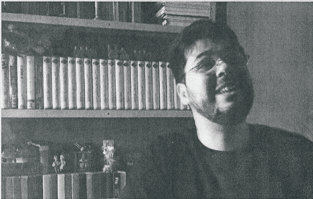
Autor de dois livros, o professor encontrou no cordel um modo de popularizar sua mensagem

Biblioteca Nacional, que é o órgão responsável, mas isso não é comprovante de direito. É bom manter provas (o original, por exemplo) de que você escreveu o texto, e uma forma de fazer isto pode ser levar o texto a um cartório e pedir para datá-lo, porque isso irá provar que àquela data o texto já havia sido escrito.